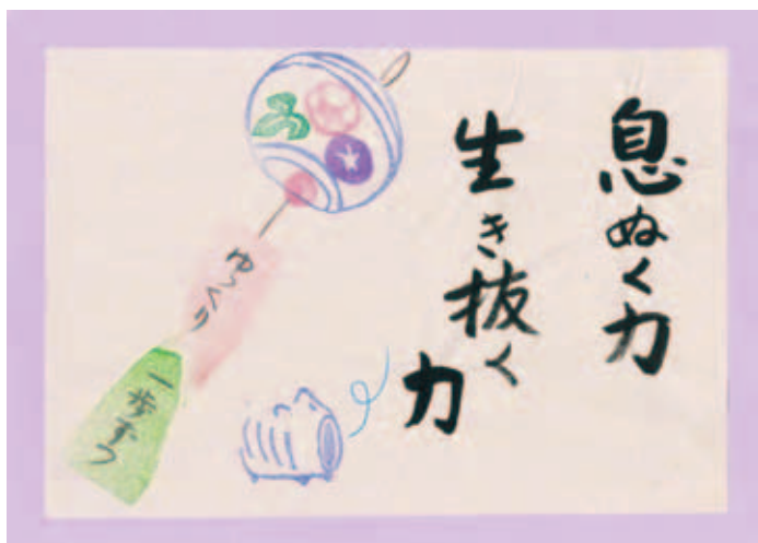
▲ほのぼの消しゴム版画作品(版:加治美千代 字:鶴田輝子)