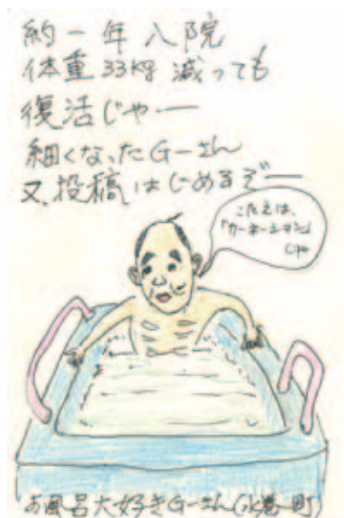
◀お風呂大好きGーさん(水巻町)