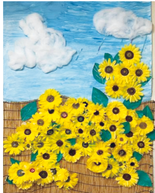
▲ミナミティサービス作品