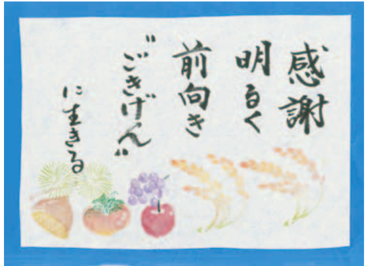
▲ほのほの消しゴム版画作品 (版:加治美千代 字:鶴田輝子)